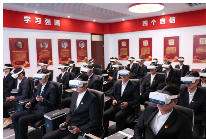
图2 VR党建与课程思政学习体验中心

信息工程系将思政工作融入“三全”育人过程中，以加强教师“供给侧”思政工作带动学生“需求侧”育人质量的提升。大力推进师德师风建设，以“四有好老师”、“四个引路人”、“四个相统一”为标准，培育出以党支部书记为领头人的一大批省级或校级优秀共产党员、十佳师德标兵、党员先锋岗，引导教师自觉践行“以德立身、以德立学、以德施教”，使教师成为党的领导的坚定拥护者、先进思想的传播者、学生成长的指导者和引路人。打造党建文化长廊，建成全国高职院校首家党建与课程思政融合的VR学习体验中心，结合信息技术专业群特点开发了党史、国史、中国龙芯、中国鸿蒙、劳动之光等VR体验馆的教学资源。将课程思政融入人才培养方案，建设《大国方略》等课程资源，深入提炼专业课程中的思政元素，发挥好“课程思政”育人功能。凝练“微笑”+“劳动”党建文化品牌，扎实推进环境育人文化育人。以科技文化艺术节、青年志愿者服务、大学生暑假“三下乡”等活动为平台，坚持理论教育与实践养成相结合，引导学生在历练中增强实践能力树立家国情怀。