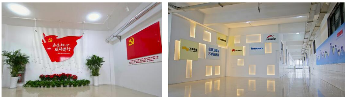
图3 信息工程系室廊文化