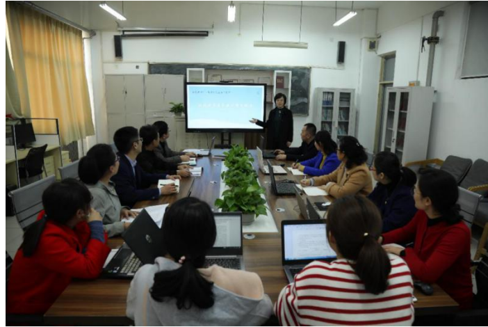
图 4 省级名师工作室研讨