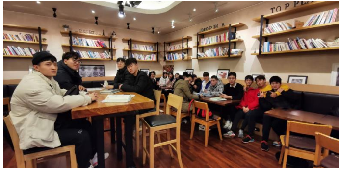
图5 我院在韩留学生参加学术沙龙