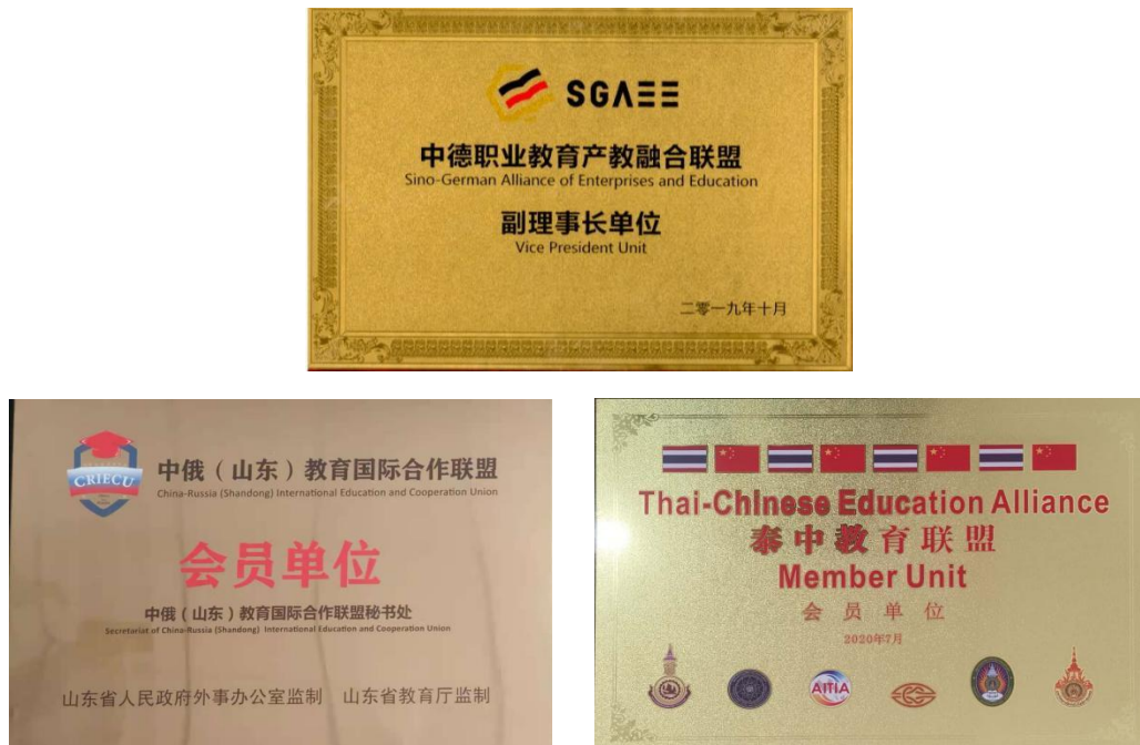
图 7 学院加入国际组织

“产、教、文、赛”。发展产业平台 3 个，发起组建中德职业教育产教融合联盟，担任“一带一路”国家院校和企业交流协会中方理事会理事单位，创建“一带一路”产教研协同创新中心；拓展教育合作平台 4 个，加入“一带一路”暨金砖国家技能发展国际联盟、泰中教育联盟、中俄（山东）教育国际合作联盟、山东省教育国际交流协会；建设文化平台 1 个，启动建设中外人文交流中心；发挥世赛平台作用，依托世赛机械设计 CAD 项目国家集训基地开展国际交流活动。