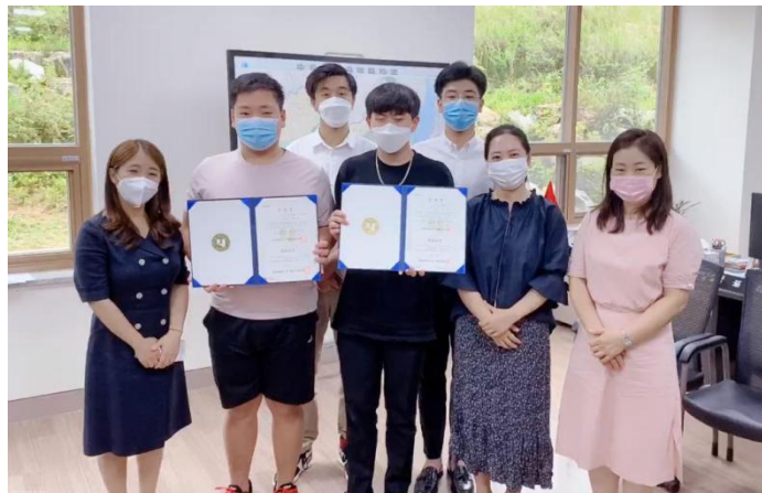
图6 韩国湖南大学为我院“云游学”项目学生举办结业典礼