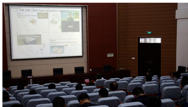
图3 学院组织开展世赛中韩专家培训讲座