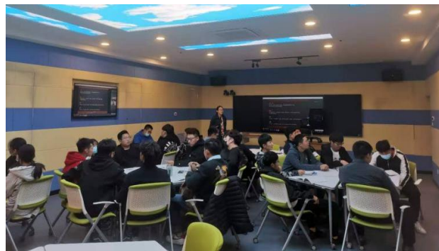
图2 中外合作办学专业学生线上韩语外教课

学院以对韩各类交流项目为依托，在专业发展方面狠下功夫。2019年同韩国京畿大学开展机械设计与制造专业和软件技术专业中外合作办学项目，引入韩国机械设计和软件技术专业技术标准 and 优质课程资源，为这两个专业卓越工匠人才培养方案和课程标准制定注入国际元素。2020年与韩国湖南大学共同成功申报韩国基金项目，引入韩语课程标准，在学院专业人才培养方案中增加韩语课程选修课程。引入世界技能大赛标准，邀请韩国企业高管、世界技能大赛机械设计 CAD 项目首席专家、韩国 NOVEL 公司 CEO 任炳铉先生开展讲座，借鉴韩国备赛经验，制定世赛标准引领的课程标准，形成独具特色的“劳职方案”，并以此推动课程标准国际化改革进程。