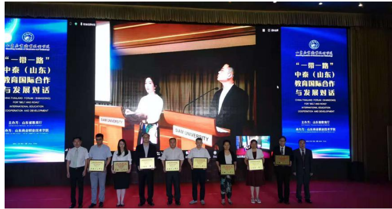
图8 学院参加“一带一路”中泰（山东）教育国际合作与发展对话 (四) 师生国际化意识逐渐养成

2020 年学院共举办国际讲座 2 个、参加国际会议 8 个、加入国际组织 5 个，在全球范围内扩大交流合作，寻找契合的合作伙伴。