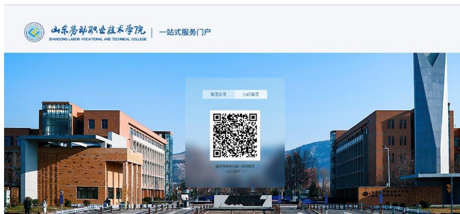
一站式服务门户登录业务

网络中心对“一站式”服务大厅涉及项目进行调研，形成了用印审批单、档案移交审批、公车申请及管理、议题申请、学院文件制发流程、部门函件制发流程、文件修改重发流程、来文传阅流程、重要会议及活动报备、公务接待审批单等完备的需求调研。对原有的数字校园统一门户进行改进，形成了新的一站式服务门户，支持用户名密码和微信扫码两种登录方式，如图所示。